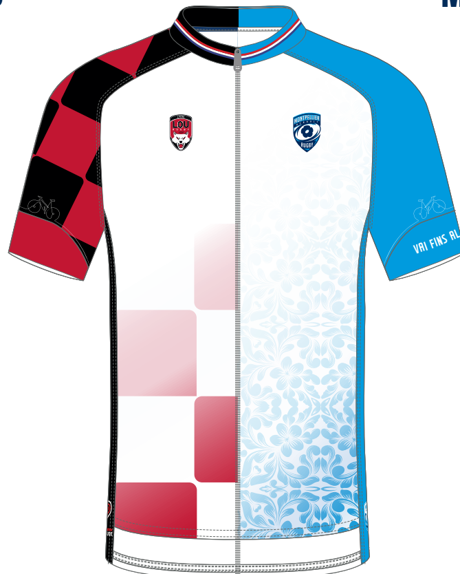
LOU / MHR